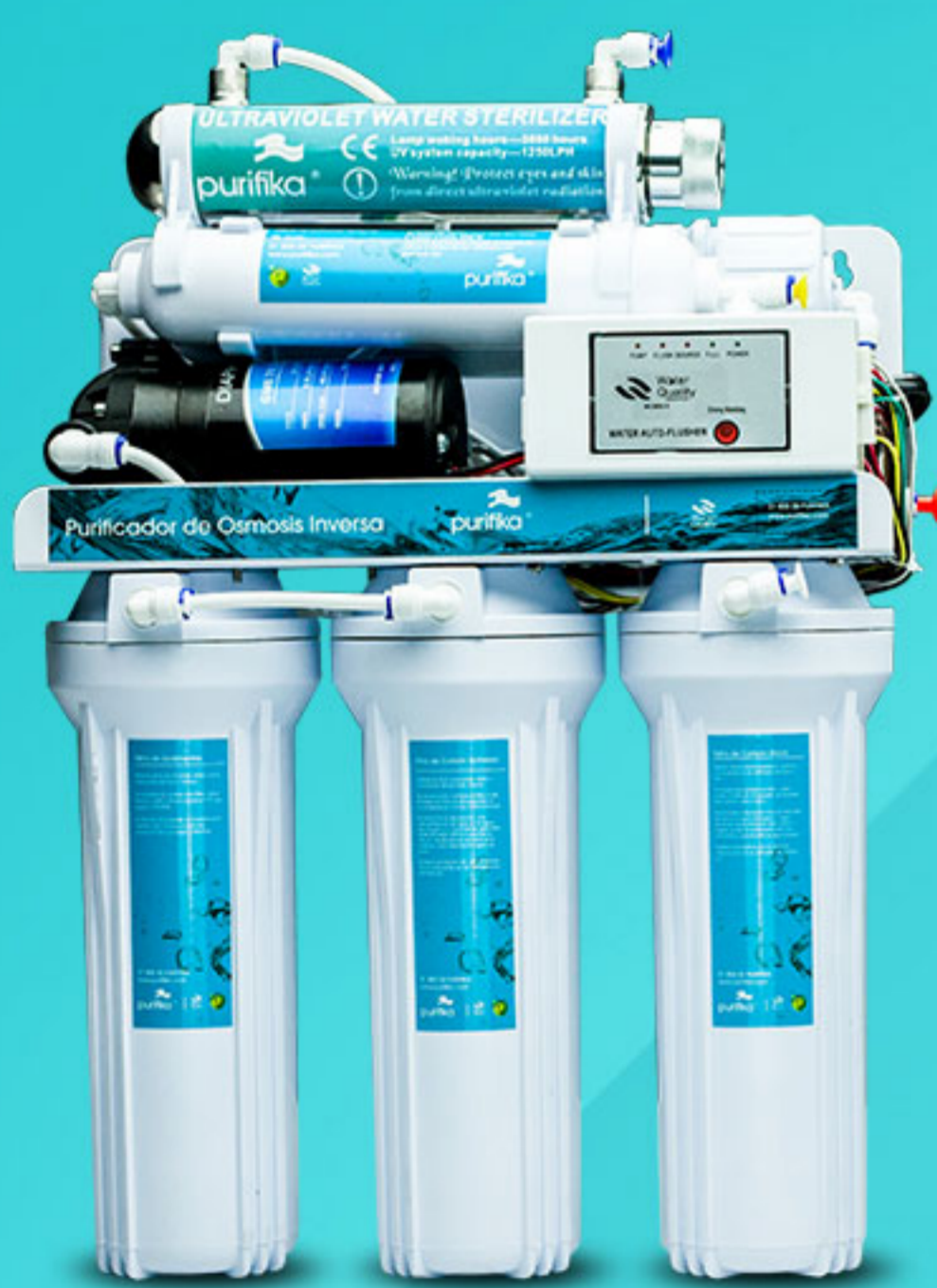
PE8 / P8 / P12 / P16 / P40N

PURIFIED CRYSTALLINE WATER RIGHT AT YOUR FINGERTIPS